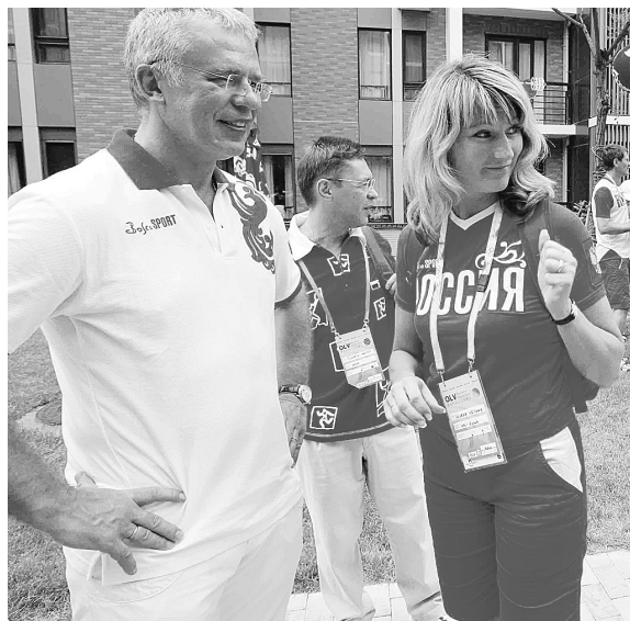
Олимпийские чемпионы Вячеслав Фетисов и Светлана Журова вдохновляли атлетов на подвиги личным примером.

Свои команды в Пекине поддерживают в основном VIP-фанаты. Простым болельщикам Игры не по карману